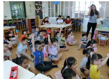
個案舉手想上台畫畫