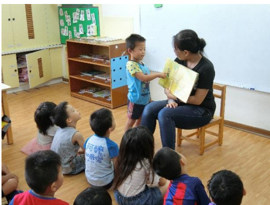
洪○杰指出動物並說出動物名字