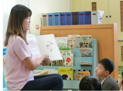
個案專注的看著繪本