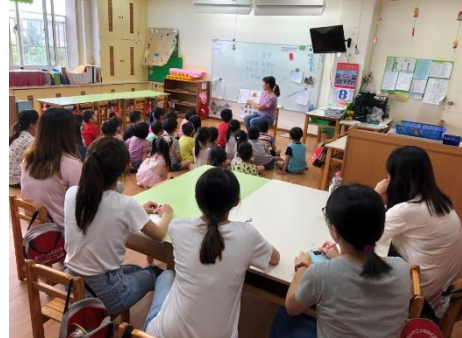
老師觀察特殊幼兒上課