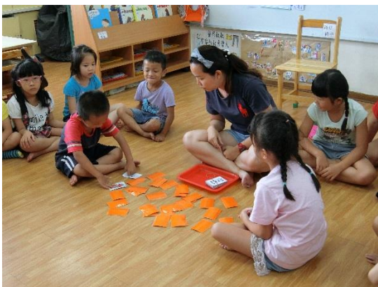
林○煌進行翻牌遊戲