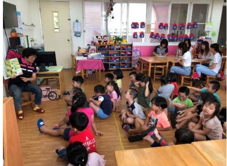
星星班個案上課情況