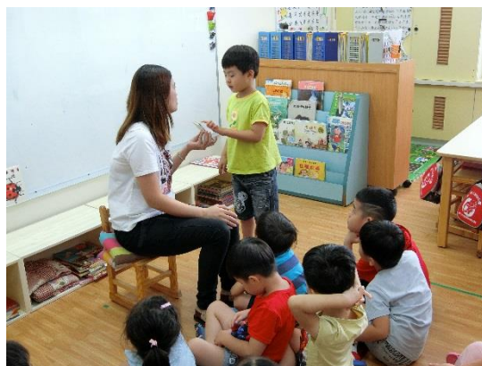
陳○維說出水果名稱