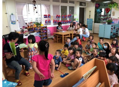
星星班特殊需求幼兒上台示範