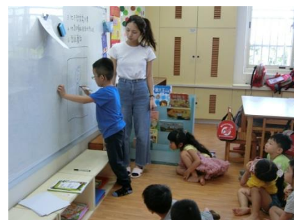
個案上台畫出自己自畫像