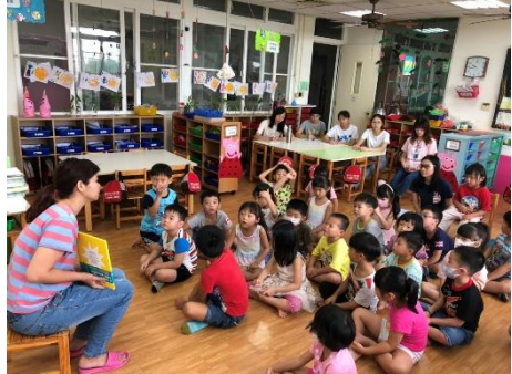
彩虹班個案上課狀況