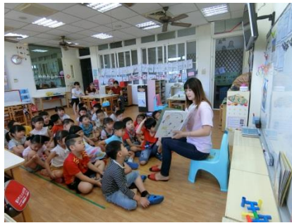
老師在說繪本給全班聽