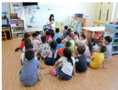
老師問個案繪本裡的問題