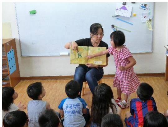
卓○秀指認動物並說出名稱