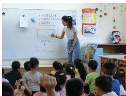
老師先示範給小朋友看