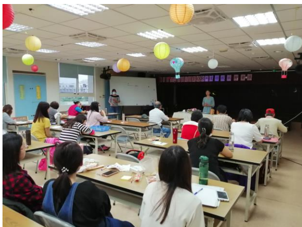
案由二~討論工作分配