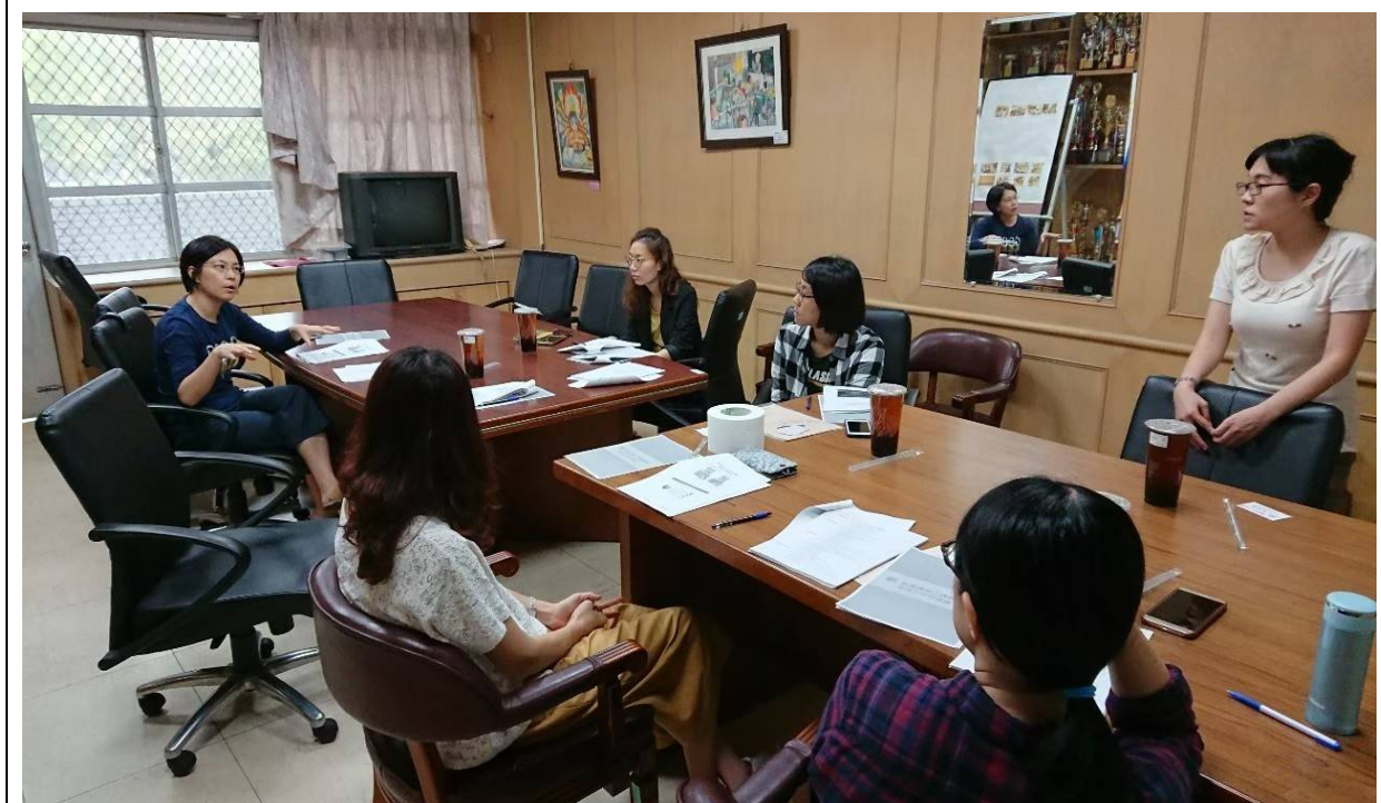
校內普教英文教師共同參與討論