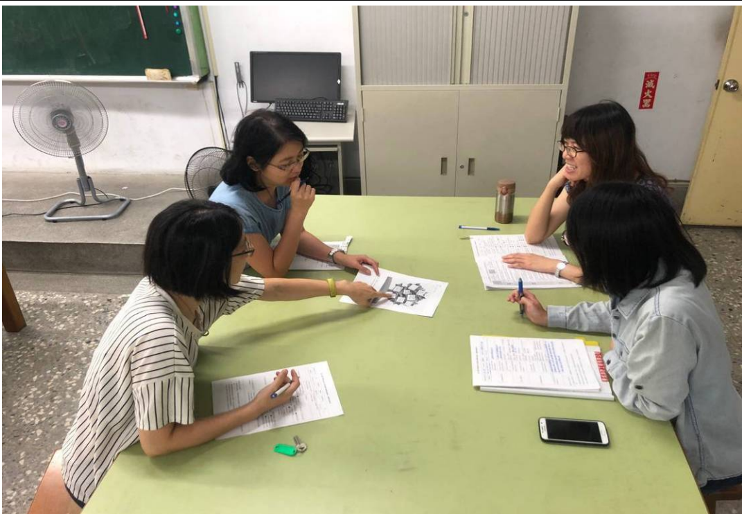
小組成員分別給予公開授課教師回饋