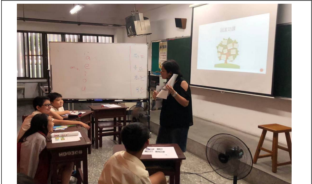
設計學習單檢視學習成效