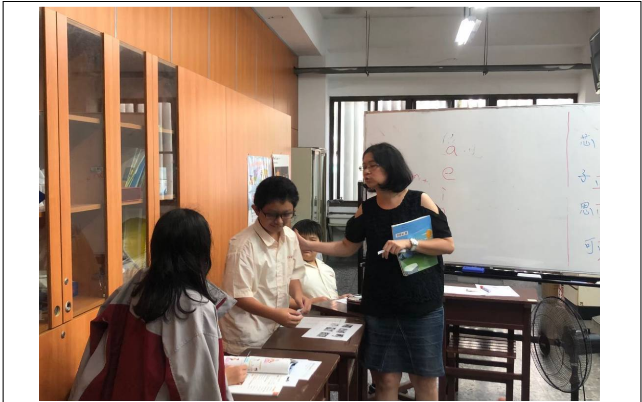
學生進行口語表達練習