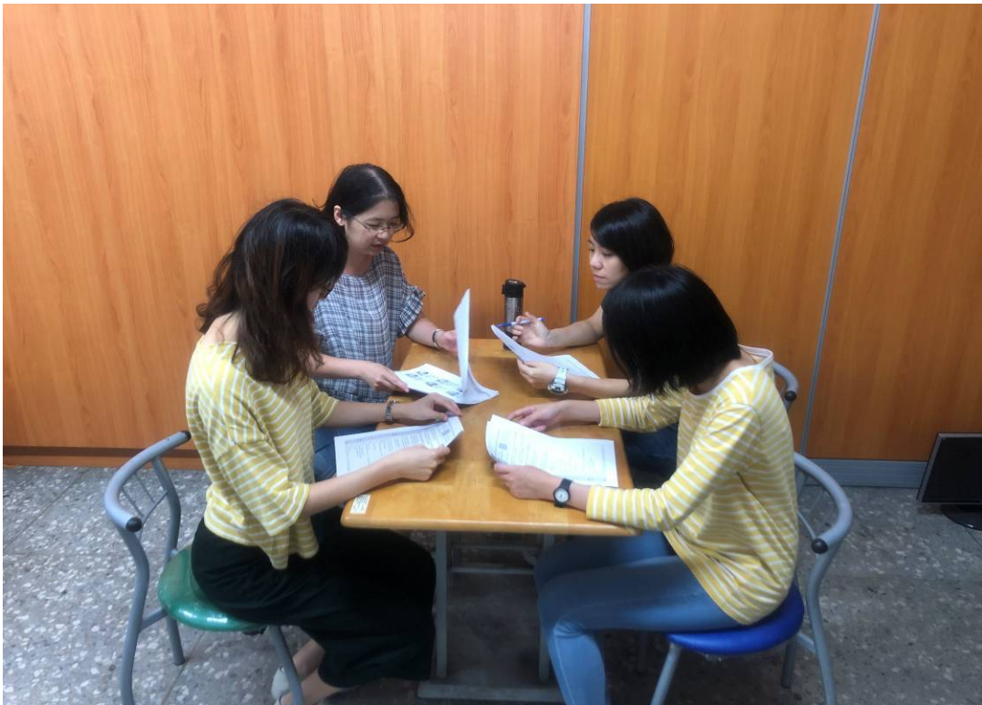
公開授課教師說明教學活動設計方式