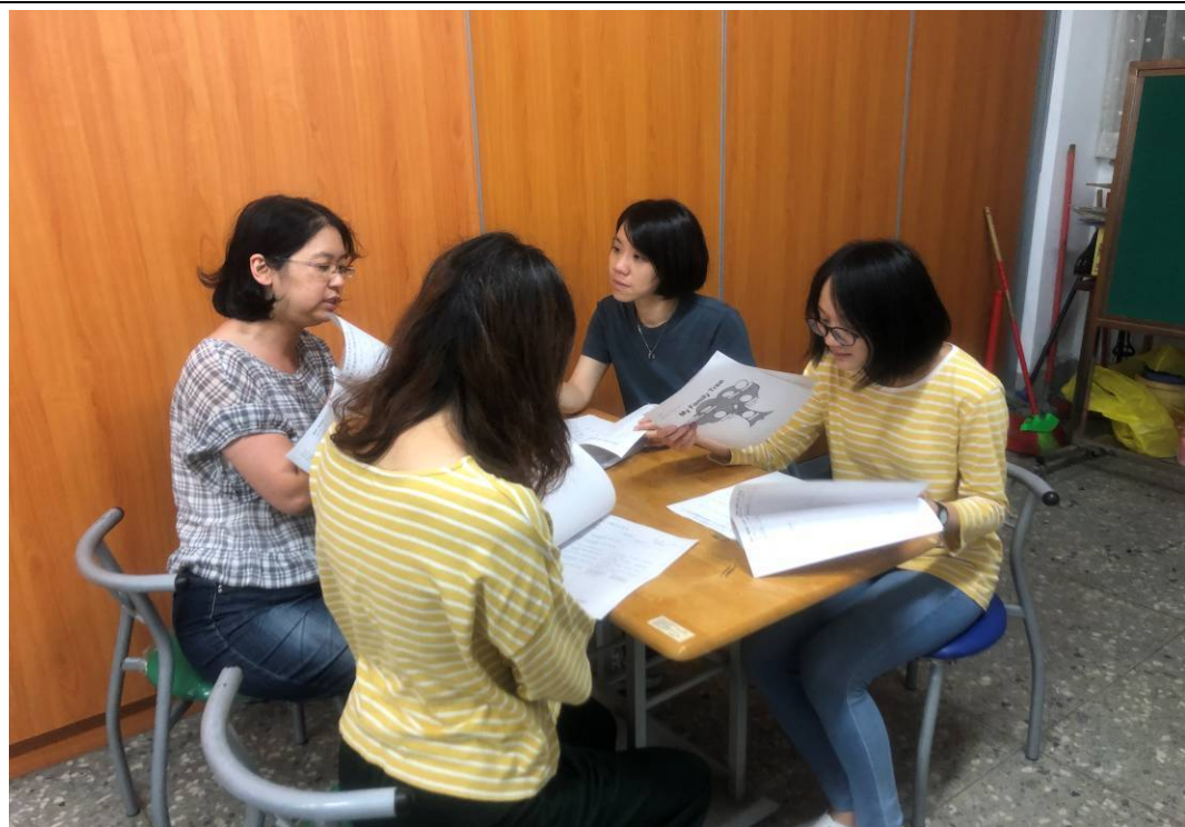
共同討論教案可行性並適時做調整