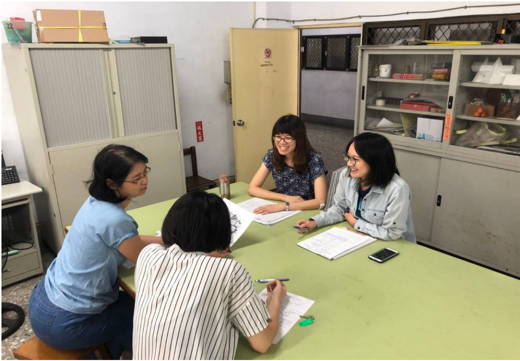
根據學生繳回學習單進行教學課程規畫檢視