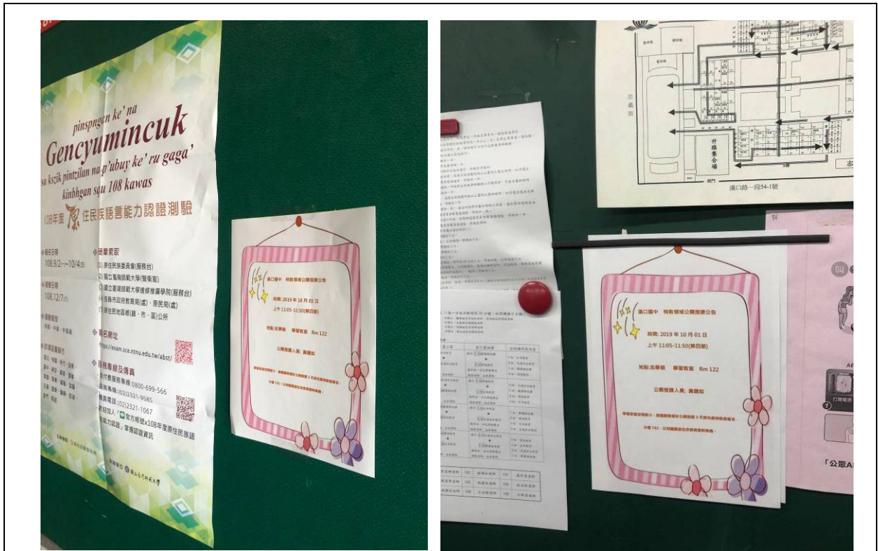
於校內公布欄宣達公開觀課授課活動