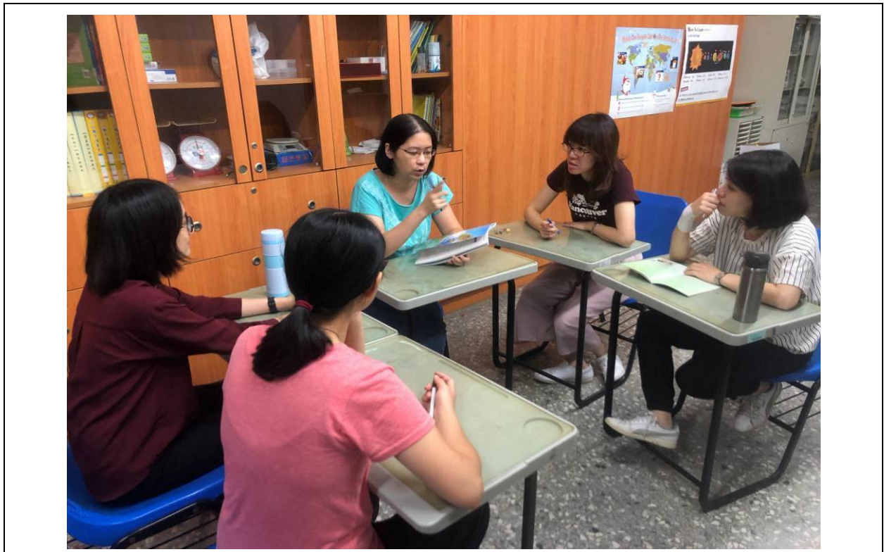
討論 108 學年度國一課程中預備教學之主題-職業