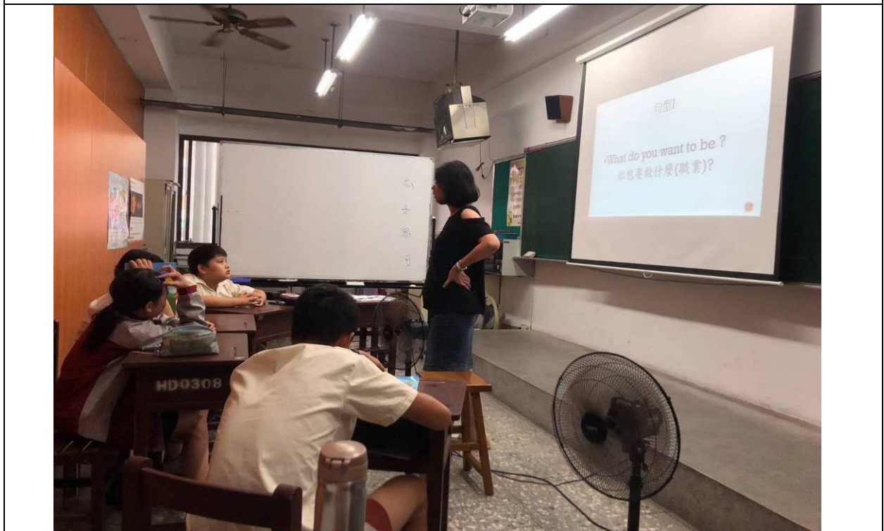
結合英語句型與生涯教育帶入主題式教學活動