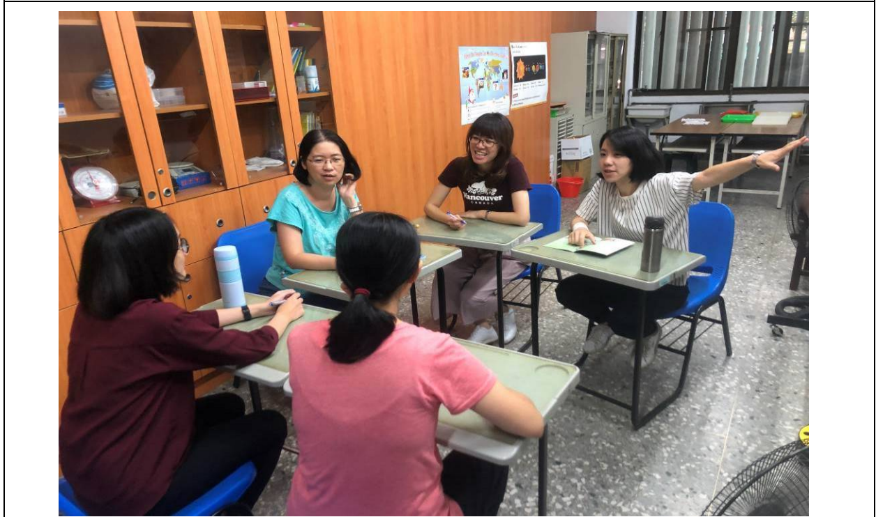
邀請普班教師協助分享在普通班任教該主題時的教學經驗