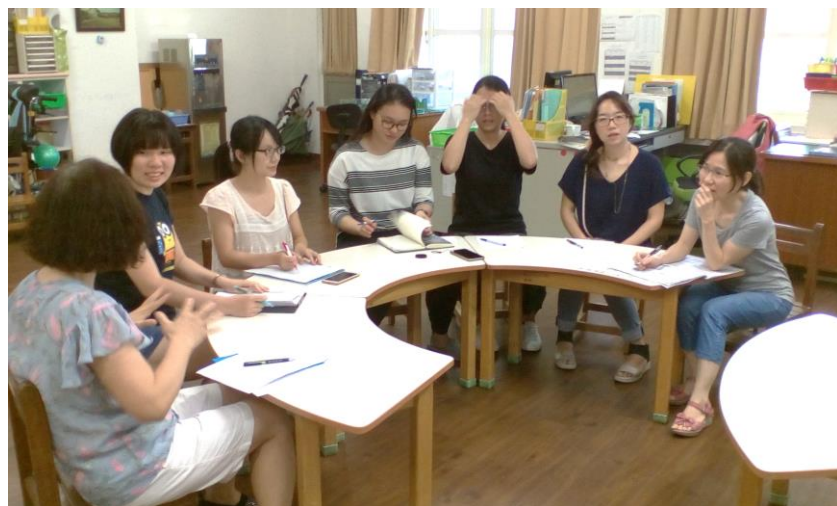
相片說明：議課照片 2