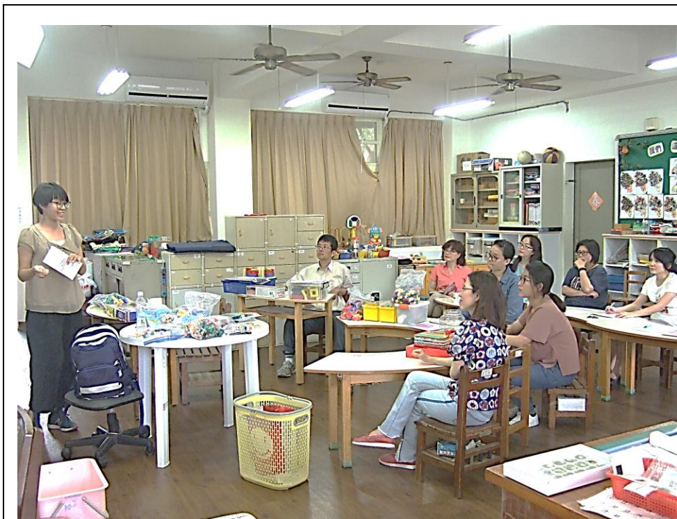
相片說明： 治療師介紹 積木的種類 促進手部功 能的活動