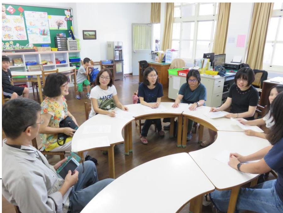
相片說明：大家對於舉辦社群活動的意見和感想分享-1